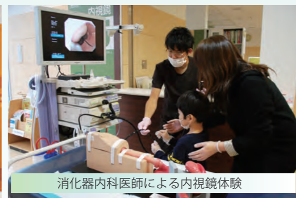
消化器内科医師による内視鏡体験