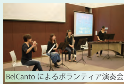
BelCantoによるボランティア演奏会