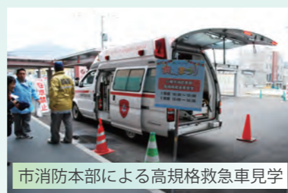
市消防本部による高規格救急車見学