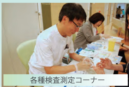
各種検査測定コーナー