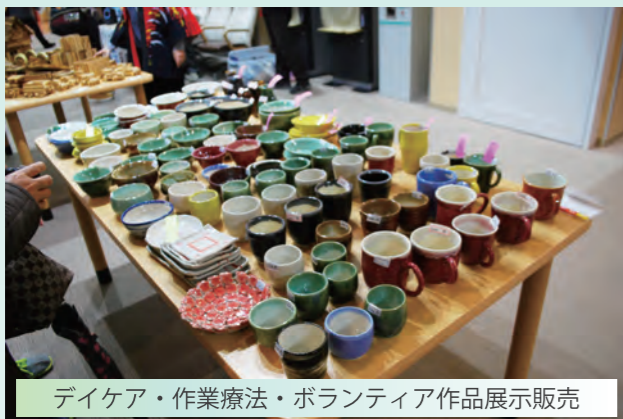
デイケア・作業療法・ボランティア作品展示販売