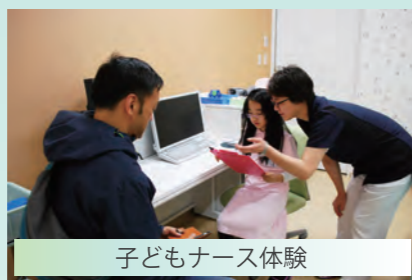
子どもナース体験