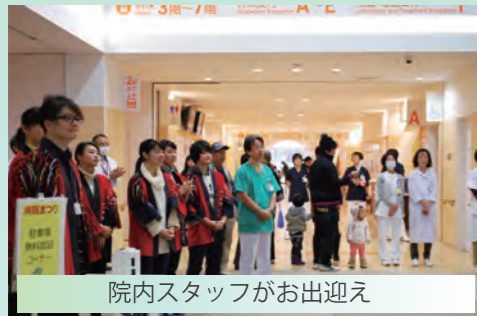
院内スタッフがお出迎え