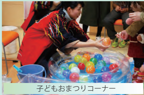
子どもおまつりコーナー