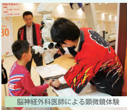
脳神経外科医師による顕微鏡体験